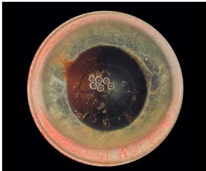
Das neue live Top-View-Bild.

sich die Kapsulotomie dann in wenigen Sekunden anpassen. Ein Abbruch der Operation ist nicht notwendig.