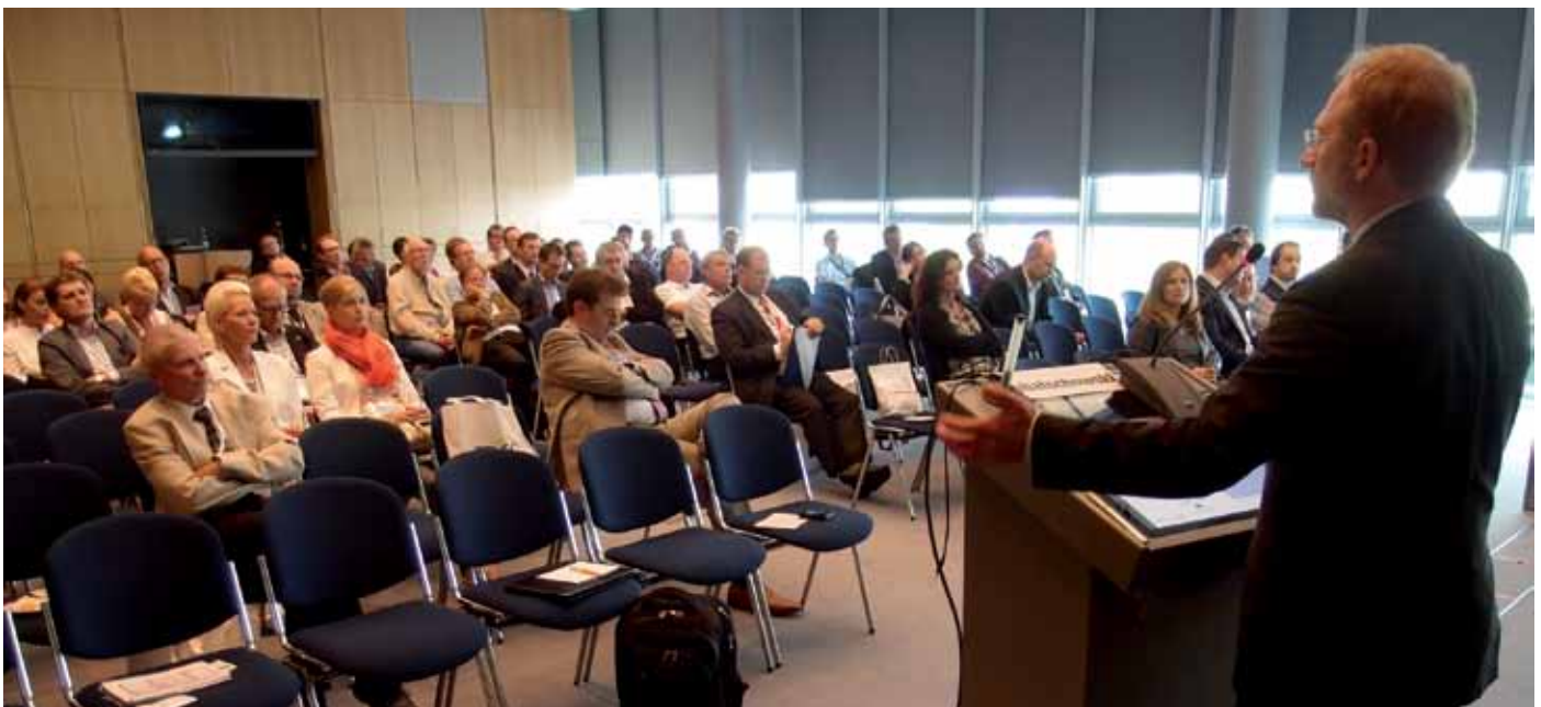
Auf großes Interesse stieß das Praxisseminar der Ziemer Ophthalmology (Deutschland) GmbH während der DOC-Tagung in Leipzig.

am nächsten Tag gut aussieht, wenn es für den Einsatz des Lasers komplett applaniert wurde – das ruft Deszemet-Falten hervor.“ Der Einsatz des Liquid Interface ist dagegen unproblematisch. Ebenso wenig gab es Schwierigkeiten mit dem Intraokulardruck. Nach dem Andocken trat bei keinem der 100 unter-