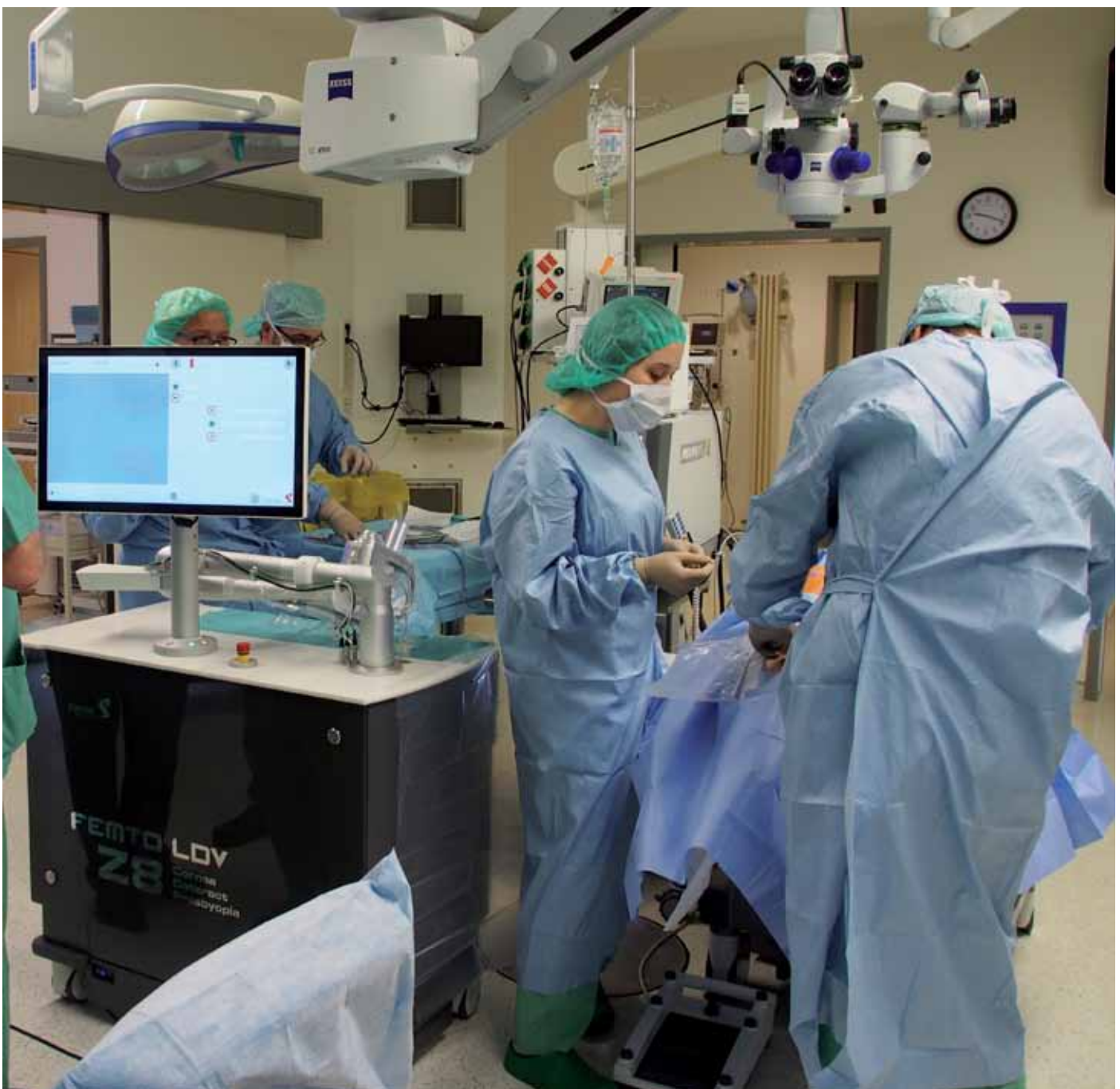
Seit gut einem Jahr ist der FEMTO LDV Z8 in der Augenklinik Sulzbach, Knappschaftsklinikum Saar im Einsatz.